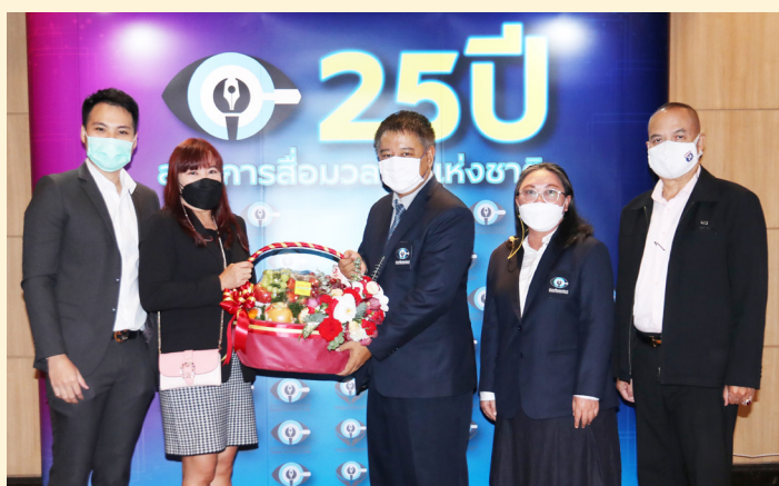
บริษัท เอเชีย เอราวัณ จำกัด