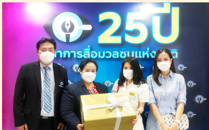
บริษัท บัตรกรุงไทย จำกัด (มหาชน)