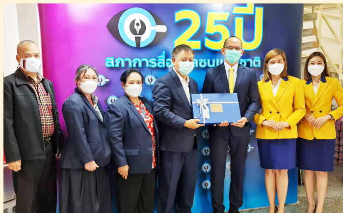
บริษัท วิริยะประกันภัย จำกัด (มหาชน)