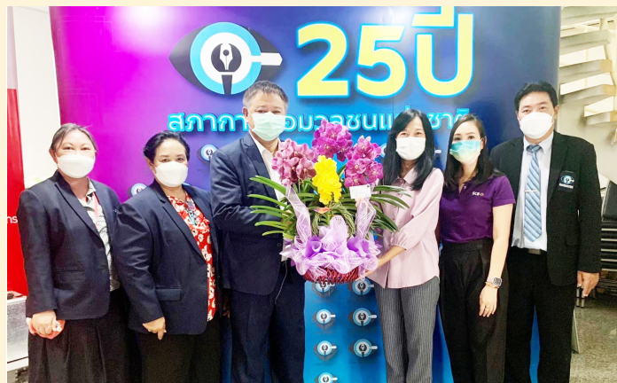
ธนาคารไทยพาณิชย์ จำกัด (มหาชน)