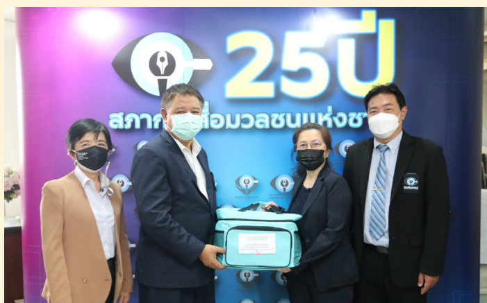
บริษัท เจริญโภคภัณฑ์อาหาร จำกัด (มหาชน)