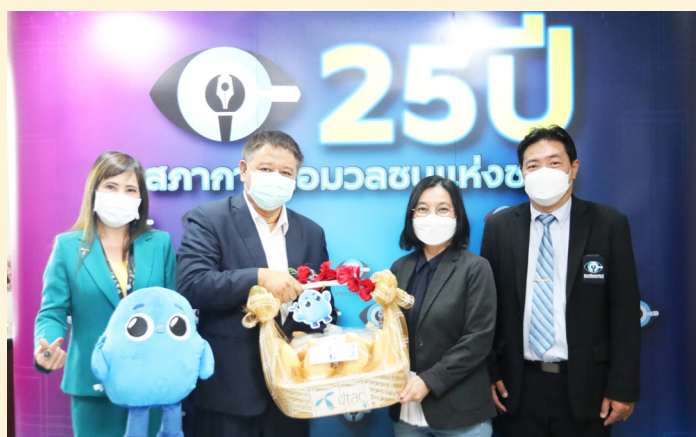
บริษัท โทเทิล แอ็คเซ็ส คอมมูนิเคชั่น จำกัด (ดีแทค)