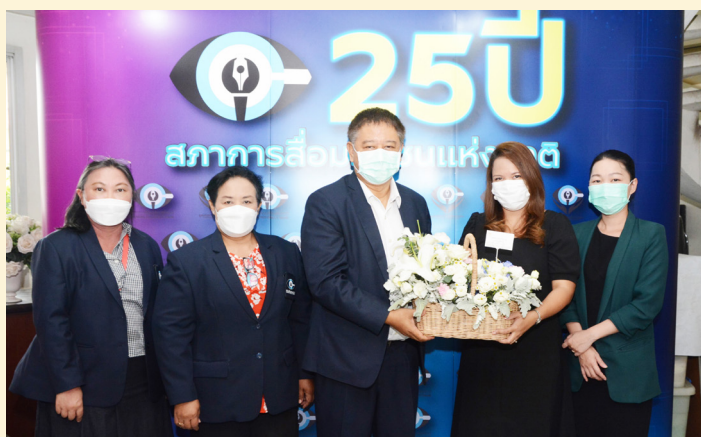
บริษัท เครือเจริญโภคภัณฑ์ จำกัด