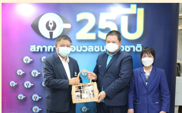
บริษัท กรุงเทพประกันชีวิต จำกัด (มหาชน)