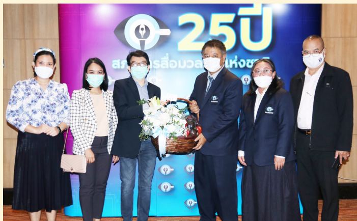
บริษัท ซีพีออลล์ จำกัด (มหาชน)