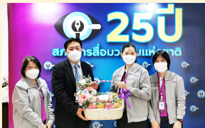
การไฟฟ้าส่วนภูมิภาค