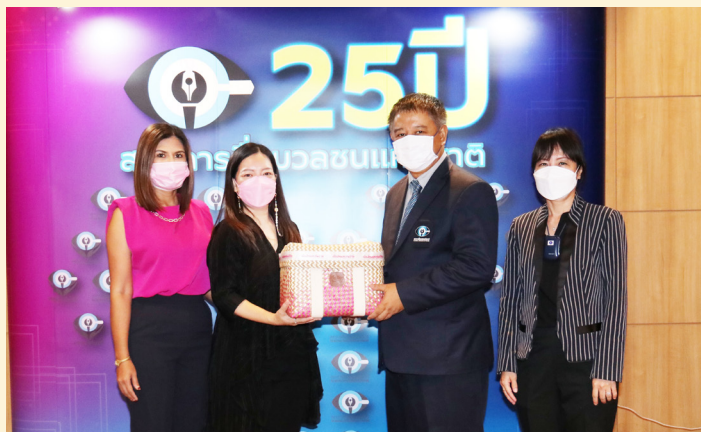
บริษัท เมืองไทยประกันชีวิต จำกัด