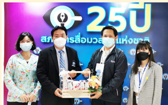
บริษัท ปตท. จำกัด (มหาชน)