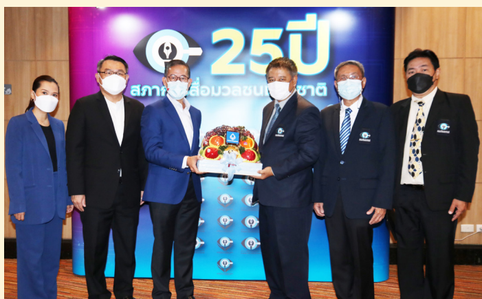
ธนาคารกรุงเทพ จำกัด (มหาชน)