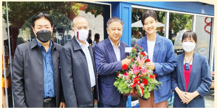
นายชวรงค์ ลิมป์ปัทมปาณี ประธานสภาการสื่อมวลชนแห่งชาติ ร่วมแสดงความยินดีครบรอบ 5 ปี พร้อมร่วมงานเปิดบ้าน สำนักข่าว เดอะ แสตนด์การ์ด โดยมีนายนครินทร์ วนกิจไพบูลย์ ประธานเจ้าหน้าที่บริหารและบรรณาธิการบริหาร ให้การต้อนรับ เมื่อวันที่ 30 มิ.ย. 2565