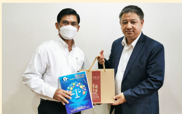
หนังสือพิมพ์ชิงเสียนเยอะเป้า