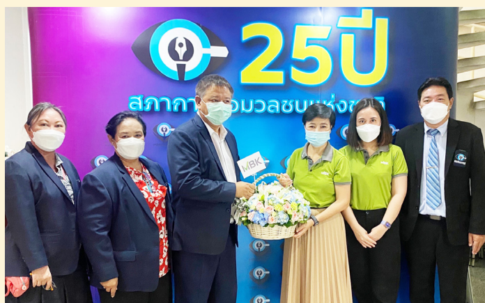
บริษัท เอ็มบีเค จำกัด (มหาชน)