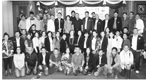
สภาการหนังสือพิมพ์ฯ ร่วมกับเครือข่ายบรรณารักษารักษ์หนังสือพิมพ์ภาคเหนือ 17 จังหวัดและ สสส. จัดอบรมเชิงปฏิบัติการโครงการพัฒนาศักยภาพสื่อมวลชนภาคเหนือ เรื่องนักข่าวมือถือ มืออาชีพพัฒนาคุณภาพชีวิต สู่ไทยแลนด์ 4.0 ที่ห้องประชุม เทศบาลจังหวัดน่าน เมื่อวันที่ 8 - 10 ธ.ค. 2561

ของประเทศไทยในขณะนี้ เพราะมีโอกาสพลาดเป้า หรือพลาดฝันสูงมาก ..... ดังนั้น ถ้าเห็นว่ปัจจัยรอบตัวหนักหนาสาหัส ก็ต้องเตรียมยิงดอกที่สองหรือสาม นั่นคือ การมองหา “งานข้ามสาย” เช่น ..... สายงานนักวิเคราะห์ข้อมูล