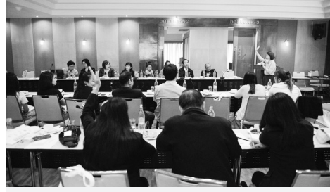
สภาการหนังสือพิมพ์ฯร่วมกับองค์กรสิทธิมนุษยชนจัดสัมมนาเชิงปฏิบัติการ “การส่งเสริมความรู้ด้านสิทธิมนุษยชนสำหรับสื่อมวลชน” เมื่อวันที่ 3 - 5 ธ.ค. 2561 ที่ รร. ดวงตะวัน เชียงใหม่