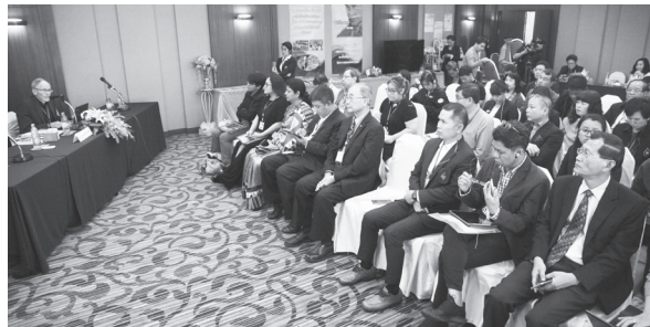
สภาการหนังสือพิมพ์ฯ ร่วมกับสมาคมนักข่าวฯ และสมาคมผู้ผลิตข่าวออนไลน์ จัดสัมมนา “การส่งเสริมผู้บริโภคข่าวรุ่นใหม่ในยุคดิจิทัล” เนื่องในโอกาสฉลอง 100 ปี ชาตกาล “กำพล วัชรพล” เมื่อวันที่ 21 พ.ย. 2561 ที่ รร. เซ็นจูรี พาร์ค กรุงเทพฯ

สภาการหนังสือพิมพ์-สมาคมนักข่าวฯ และสื่ออาเซียน เปิดเวทีสัมมนา “การส่งเสริมผู้บริโภคข่าวรุ่นใหม่ในยุคดิจิทัล” เพื่อแลกเปลี่ยนประสบการณ์ ที่เกิดขึ้นในแต่ละประเทศ และผลักดันให้คนรุ่นใหม่ หันมาวิธีการอ่านหนังสือพิมพ์ ทั้งหนังสือพิมพ์แบบกระดาษและหนังสือพิมพ์ออนไลน์ เพื่อเสริมสร้างประสบการณ์และรู้เท่าทันสื่อดิจิทัล