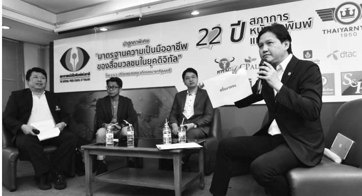
สภาการหนังสือพิมพ์แห่งชาติ จัดเสวนาทางวิชาการ เรื่อง “สื่อ...การปรับตัว และสถาปนาก่อตั้งมาตรฐานความเป็นมืออาชีพ” ในโอกาสครบรอบ 22 ปี สภาการหนังสือพิมพ์แห่งชาติ เมื่อวันที่ 4 ก.ค. 2562