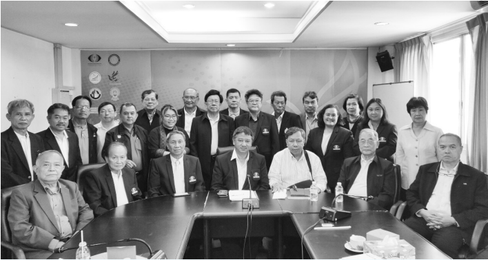
คณะกรรมการบริหารสภาการหนังสือพิมพ์แห่งชาติ ประชุมสรุปผลการดำเนินงานในรอบปี แลกเปลี่ยนความคิดเห็นร่วมกันของสมาชิกสภาการฯ ปีละครั้ง เมื่อวันที่ 4 ก.ค. 2562

สภาการหนังสือพิมพ์แห่งชาติ ได้จัดการประกวดบทบรรณาธิการ (บทนำ) ดีเด่น ต่อเนื่องมาเป็นปีที่ 9 โดยในโอกาสครบรอบ 22 ปี สภาการหนังสือพิมพ์แห่งชาติ ในปีนี้มีหนังสือพิมพ์ที่ส่ง (อ่านต่อหน้า 10)