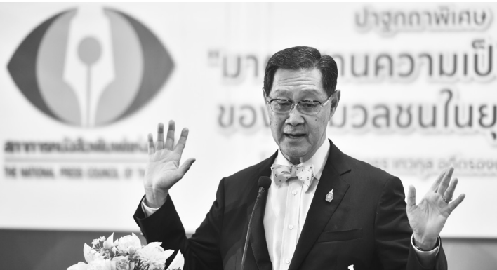
ม.ร.ว.ปรีดิยาธร เทวกุล อดีตรองนายกรัฐมนตรี กล่าวปาฐกถาพิเศษ เรื่อง “มาตรฐานความเป็นมืออาชีพของสื่อมวลชนในยุคดิจิทัล” เนื่องในโอกาสครบรอบ 22 ปี สภาการหนังสือพิมพ์แห่งชาติ เมื่อวันที่ 4 ก.ค. 2562

เนื่องในโอกาสครบรอบ 22 ปี สภาการหนังสือพิมพ์แห่งชาติ นายชวรงค์ ดิมปีปัทมปาณี ประธานสภาการหนังสือพิมพ์แห่งชาติ กล่าวเปิดงานเมื่อวันที่ 4 ก.ค. 2562 ว่า เมื่อ 22 ปีก่อนเป็นวันสำคัญของผู้ประกอบการวิชาชีพหนังสือพิมพ์ทั่วประเทศ ได้มารวมตัวลงนามในบันทึกจัดตั้งสภาการหนังสือพิมพ์แห่งชาติ เพื่อทำหน้าที่กำกับตนเองทางด้านจริยธรรม และ 22 ปีที่ผ่านมาได้ทำหน้าที่กำกับดูแล (อ่านต่อหน้า 9)