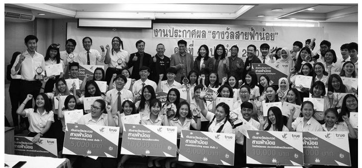
สมาคมนักข่าววิทยุและโทรทัศน์ไทย ร่วมกับ บมจ.ทรู คอร์ปอเรชั่น จัดงาน ประกาศผลรางวัลสายฟ้าบ่อย ครั้งที่ 13 ประจำปี พ.ศ. 2560 โดยในปีนี้มี ม.เชียงใหม่ คำรางวัลด้านวิทยุดีเด่น มรท.สงขลา คำสูงสุด 4 รางวัล ตามติดด้วย ม.รังสิต 2 รางวัล, โดยมี ม.กรุงเทพ, ม.มหาสารคาม และ มรท.สวนสุนันทา ได้ที่ละ 1 รางวัล เมื่อวันที่ 16 ธ.ค. 2560