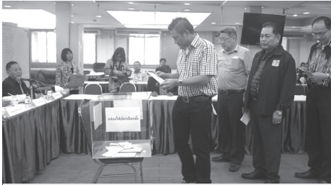
การเลือกตั้งคณะกรรมการสภาการหนังสือพิมพ์แห่งชาติ สมัยที่ 8 เมื่อวันที่ 12 ก.พ. 2558

วาระการดำรงตำแหน่งกรรมการสภาการหนังสือพิมพ์แห่งชาติ ถูกกำหนดไว้ตามธรรมนูญสภาการหนังสือพิมพ์ฯ ว่า กรรมการมีวาระการดำรงตำแหน่ง 3 ปี นับแต่วันที่ได้รับการเลือกตั้ง แต่จะดำรงตำแหน่งเกินกว่าสองวาระติดต่อกันไม่ได้