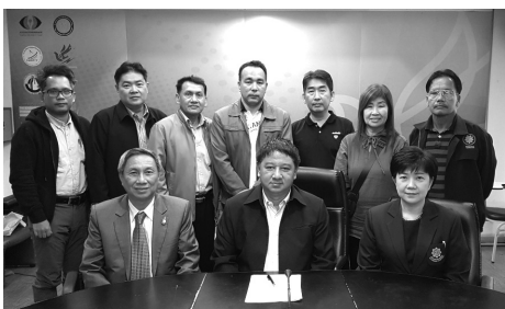
สภาการหนังสือพิมพ์ฯ จัดประชุมรับฟังความคิดเห็นต่อร่างแนวปฏิบัติสภาการหนังสือพิมพ์แห่งชาติ เรื่องการนำเสนอข้อมูล ข่าว และภาพ ความเชื่อทางไสยศาสตร์ ตัวเลข และสลากพนัน เมื่อวันที่ 18 ธ.ค.2560 ณ อาคารสมาคมนักข่าวหนังสือพิมพ์แห่งประเทศไทย

“หยิกนิด สะกิดหน่อย” ฉบับเดือน มกราคม - กุมภาพันธ์ 2561..... ช่วงเวลาที่หลายคนเตรียมคำถามไว้ถามกันเมื่อยามเจอหน้าว่า “เราจะอยู่กันอย่างไรร” ภายใต้การถดถอยของสื่อที่เกิดขึ้นต่อเนื่องจากปี 2560 ..... แม้คำตอบจะยังไม่ชัด แต่ที่ “คอนเฟิร์ม” เป็นเรื่องเป็นราวได้แล้วคือ คนสื่อที่ถูกปลดออกจากรางานมากในปีที่ผ่านมา นั้น จะทำอะไรกัน ..... สื่อรุ่นกลางจำนวนไม่น้อย มีความคิดที่จะรวมกลุ่มเพื่อนพ้องน้องพี่ จัดตั้งสำนักข่าวออนไลน์ เพื่อรักษาที่ยืนของทุกคน (ที่ตกงาน) ไว้ เนื่องจากไม่ต้องการให้ทุนรอนมากมายในช่วงเริ่มต้น ..... งานนี้ขอบอกว่า เบอร์เซ็นต์ความเป็นไปได้มีสูงพอๆ กับเป็นไปได้ไม่ได้ ..... เหตุผลคือ ทุกวันนี้ “คนสื่อ” จำนวนไม่น้อย มีความรู้ความสามารถทางด้านเทคโนโลยี และ “คอนเทนต์” จนพอที่จะยืนอยู่บนขาของตัวเองได้ โดยที่ไม่ต้องพึ่งพาใคร ..... ช.ต.พ. ครับ ..... ขณะที่ “กูรู” ในวงการ ฟันธง “ทิศทางสื่อไทยในปี ‘61” ว่า ระวัง “สีนามิ” จะขึ้นกระหน่ำวงการสื่ออีกระลอก ..... ซึ่งนั่นหมายถึงบรรดา “นกน้อยในไร่ส้ม” ก็จะได้รับผลกระทบไม่ยิ่งหย่อนไปกว่าปีที่ผ่านมา ดังนั้นการเตรียมตัวรับสถานการณ์จึงไม่ใช่เรื่องเสียหาย