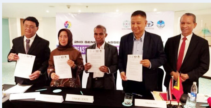
นายชวรงค์ ลิมป์ปัทมปาณี ประธานสภาการสื่อมวลชนแห่งชาติ ร่วมการประชุมใหญ่สามัญของเครือข่ายสภาสื่อมวลชนในภูมิภาคเอเชียตะวันออกเฉียงใต้ (Southeast Asian Press Council Network (SEAPC-Net): General Assembly) ครั้งที่ 2 ซึ่งจัดขึ้นที่เกาะบาห์ลี ประเทศอินโดนีเซีย เมื่อวันที่ 29 พ.ย. 2566

ประโยชน์ของประชาชน ■...ขณะที่ สมาคมนักข่าวนักหนังสือพิมพ์แห่งประเทศไทย ได้จัดทำรายงานสถานการณ์สื่อมวลชนในรอบปี 2566: ปีแห่งการปรับตัวของสื่อ เผยแพร่ผ่านเว็บไซต์ tja.or.th โดยระบุว่า สื่ออยู่ภายใต้สถานการณ์ “ปรับเปลี่ยน: ปรับตัว” จากการเปลี่ยนผ่านทางการเมือง และความเปลี่ยนแปลงของเทคโนโลยีที่มีการเปลี่ยนแปลงอยู่ตลอดเวลา โดยในปีนี้ นับเป็นปีแห่งการเปลี่ยนแปลงทางการเมืองในรอบ 9 ปี จากรัฐบาล “พล.ประยุทธ์ จันทร์โอชา” มาเป็นรัฐบาล “เศรษฐา ทวีสิน” ซึ่งเป็นผลจากการเลือกตั้งทั่วไปเมื่อวันที่ 14 พฤษภาคม 2566 ■...ทำให้สื่อมวลชนหลายสำนักค่อย ๆ ปรับตัวในช่วงเปลี่ยนผ่านนี้ อย่างมีนัยยะสำคัญ โดยเน้นเนื้อหาเชิงสร้างสรรค์และเฉพาะเจาะจงเพื่อเข้าไปให้ตรงถึงกลุ่มเป้าหมายผ่านแพลตฟอร์มต่าง ๆ ทั้งของตัวเองและโซเชียลมีเดียต่าง ๆ เพื่อให้ได้มาซึ่งรายได้และความอยู่รอด ■...แต่ยังถูกตั้งข้อสังเกตว่าสื่อกระแสหลัก ยังมีจำนวนน้อยที่รายงานข่าวเชิง